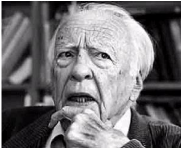
Hans-Georg Gadamer 1900 - 2002